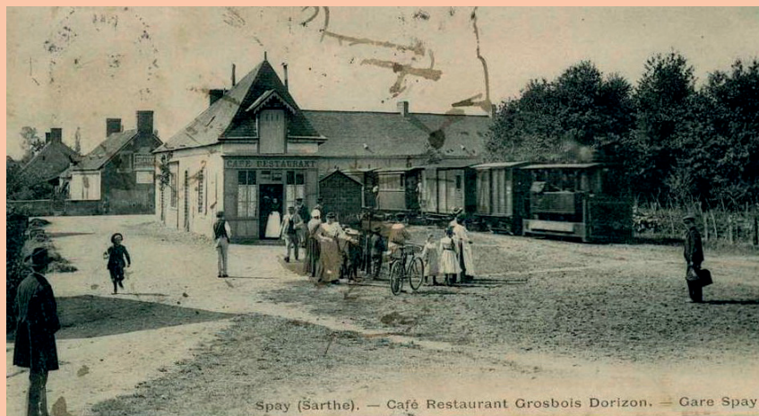
Spay (Sarthe). — Café Restaurant Grosbois Dorizon. — Gare Spay.

Allonnes (+ 5 km), Spay (+ 10 km), Fillé (+ 14 km), Guécélard (+ 17 km), Parigné-le-Pôlin, (+ 20 km), Cérans-Foulletourte (+ 24 km), Oizé (+ 26 km), Yvré-le-Pôlin (+ 30 km), Requeil, (+ 34 km), Mansigné (+ 38 km), Pontvallain (+ 43 km) et Mayet (+ 49 km).